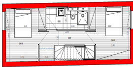
LOT 301 (BAT E) R+1 1:50